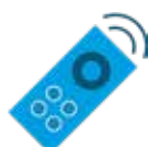
REMOTE DOWNLOAD DIGITALER TACHOGRAPH

Unser ganzer Stolz ist die komplett frei konfigurierbare Fahrerliga, welche wir auf Ihre Bedürfnisse und Anforderungen einrichten können. Dank dem Flottenscore ist auf einen Blick erkennbar, wie sich der Fuhrpark in Summe entwickelt hat. Fahrerberichte zum Ausdrucken sowie ein eigens entwickeltes Fahrerportal runden unsere Fahrerliga ab.